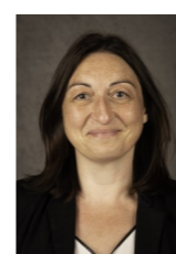
Maire de ST-GENIS D'HIERSAC